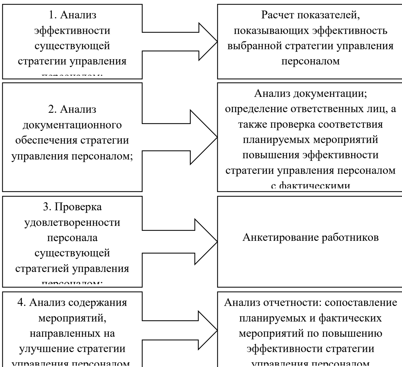
Рис. 2. Методы определения эффективности кадровой стратегии организации

На каждом из направлений используются методы, способствующие достижению поставленных на каждом из направлений целей, указанных на рис.2: